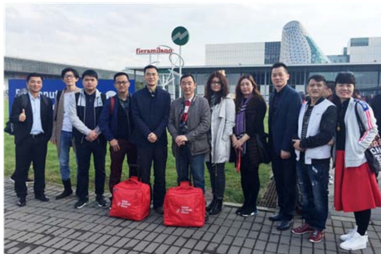
意大利米兰国际家具展考察交流

6天展会，343,602位观众，吸引来自165个国家，全球业界同仁前往“朝圣”。为了加强对外交流合作，帮助家具企业拓展市场，开阔视野，学习先进理念和了解前沿趋势，在王克会长、张承志副会长兼秘书长的带领下，广东省家具协会组织部分会员企业参观了本次展会，并进行系列考察交流活动。