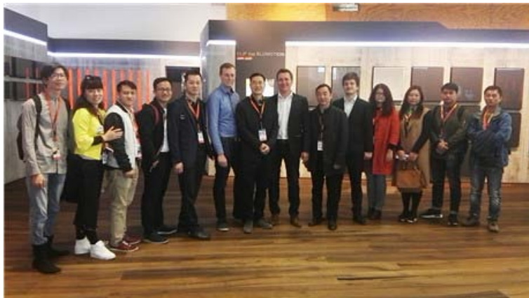
奥地利布雷根茨百隆（Blum）五金企业交流考察活动

展会期间，考察团先后参观了米兰国际家具展区（SalonedelMobileMilano）、米兰三年展区（SalonedelMobileMilano）与托妥那（Tortona）展区，并重点考察了全球家具五金一流生产企业——奥地利布雷根茨百隆（Blum）公司的设计研发、市场营销、现代化工厂，扩大广东家具的朋友圈，增进友谊与合作。