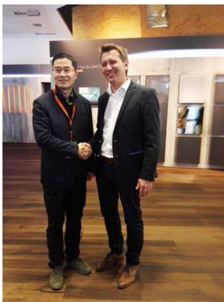
奥地利布雷根茨百隆（Blum）五金企业交流考察活动

多年来，广东省家具协会一直重视通过国际交往提升行业发展水平，每年都组团赴意大利米兰等国知名家具展和企业进行参观考察，为会员企业搭建交流合作，拓展市场的良好平台，提高企业的国际竞争力，进一步推动行业的健康稳步发展。