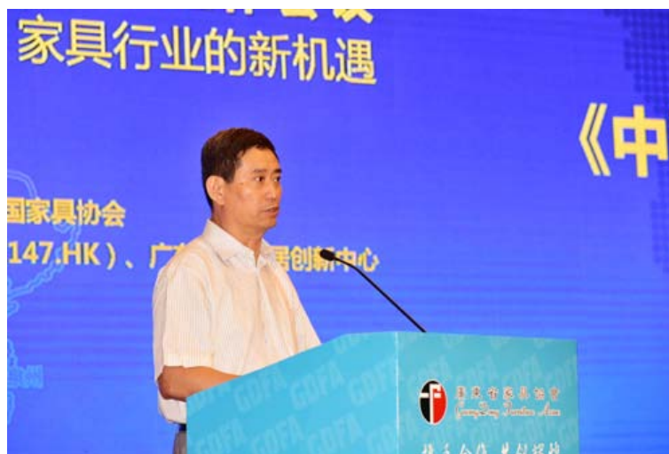
中国家具协会理事长朱长岭

为此，王克会长提出，拓展“一带一路”家具市场六大战术：多元化战术、请进来战术、走出去战术、金融战术、公平贸易战术、品牌战术。“一带一路”倡议涉及众多产业和巨量的要素调动，其间产生的各种机遇不可估量，不容错过。广东家具行业未来必须继续坚持“创新驱动、技术改造、环境治理、优化升级”的行业发展思路，积极拓展“一带一路”沿线国家和地区的家市场，为中国家具行业健康稳步发展作出更大的贡献。